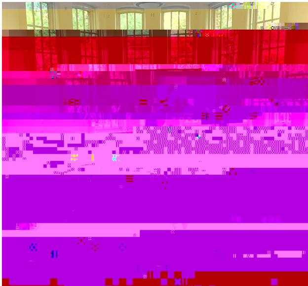
Medium Collaboration Space