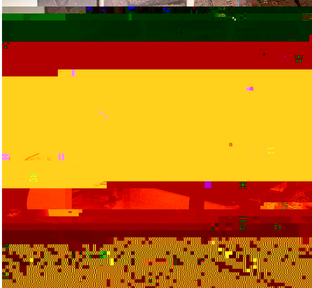
Individual Work Station